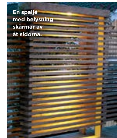
En spalje med belysning skärmar av åt sidorna.

Prydnadsträdet är en dvärgsyren. Kantväxten är lavendel eller kantnepeeta. Mörkt lila fält är stäppsalia. Ljust rosa fält är kinesisk kärleksört. Mörkt rosa cirklar är rosenflockel och röd solhatt.