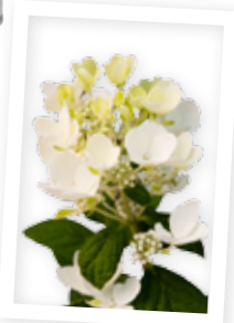
Vipphortensia "White Diamond". Tålig växt som blommar juli-september. Zon 3(4). Blomsterlandet.