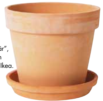
Rymlig terrakotta-kruka "Rönnbär", h 32 cm, diam 38 cm, 45 kr, Ikea.

Fristående växtvägg som blommorna kan klättra på. "Beekman", 5 500 kr, Vansta Trädgård.