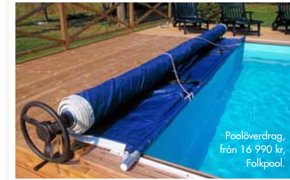
Poolöverdrag, från 16 990 kr, Folkpool.