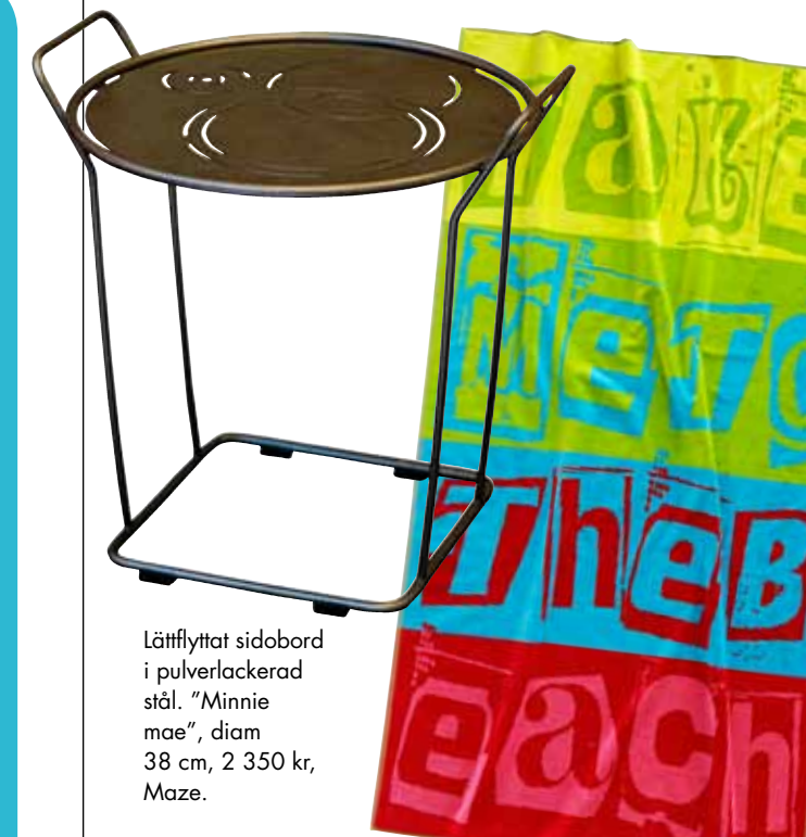
Lättflyttat sidobord i pulverlackerad stål. "Minnie mae", diam 38 cm, 2 350 kr, Maze.