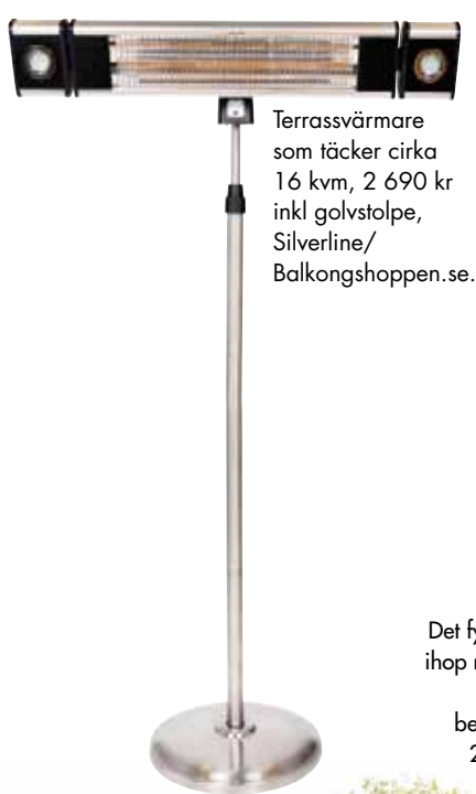
Terrassvärmare som täcker cirka 16 kvm, 2 690 kr inkl golvstolpe, Silverline/Balkongshoppen.se.