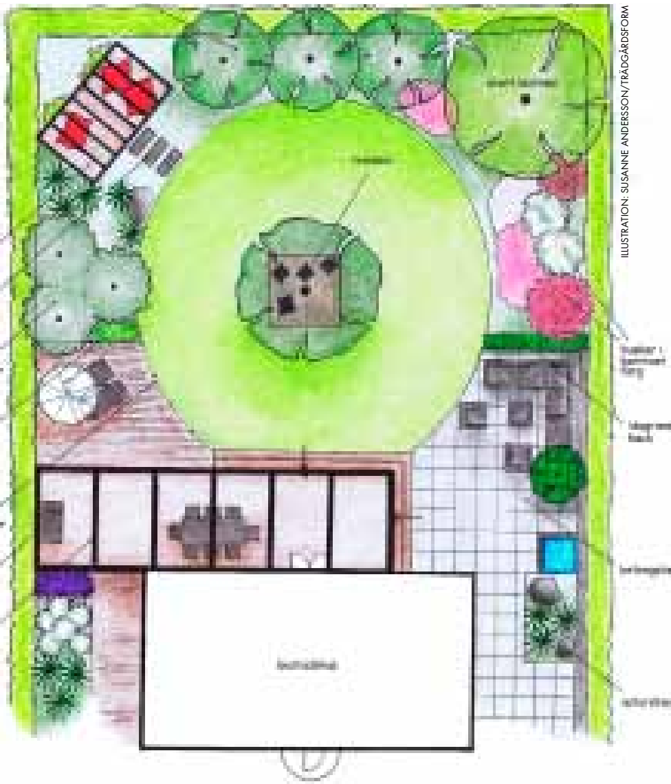
ILLUSTRATION: SUSANNE ANDERSSON/TRÄDGÅRDSFORM