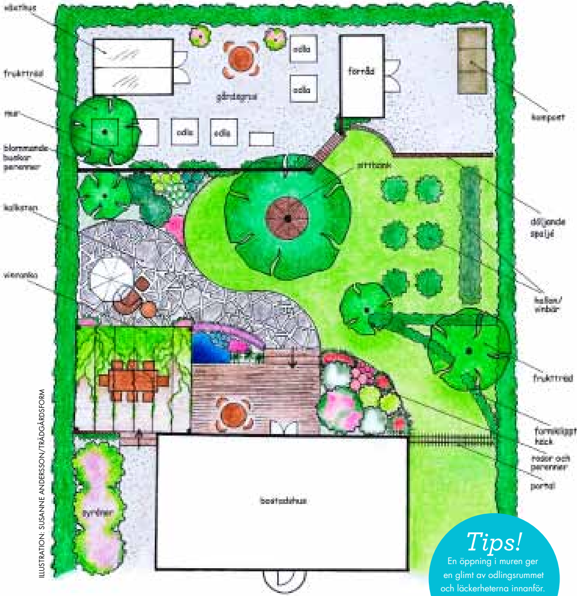
ILLUSTRATION: SUSANNE ANDERSSON/TRÄDGÅRDSFORM