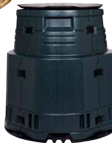
Kompostbehållare som lämpar sig både till trädgårds- och hushållsavfall. "Master", 375 liter, 1 495 kr, Greenline/Miljöcenter.