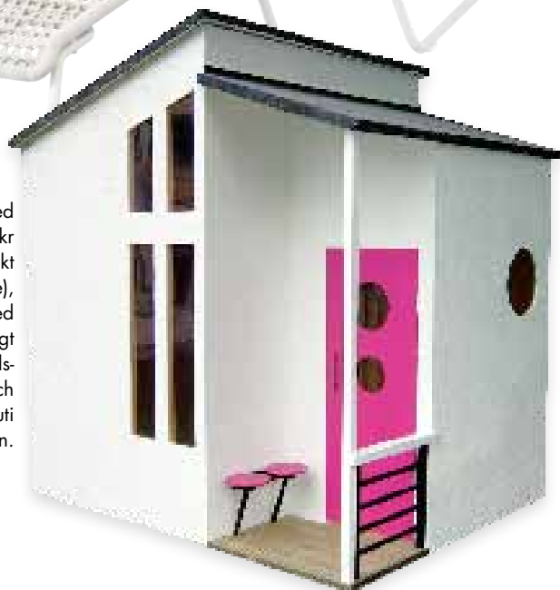
Lekstuga "Funkis med loft", 19 900 kr (inklusive frakt inom Sverige), Minihusen. En bred dörr gör det möjligt att lagra trädgårdsmöbler och gräsklippare inuti på vintern.