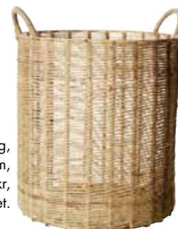
Jutekorg, h 37 cm, 399 kr, Blomsterlandet.