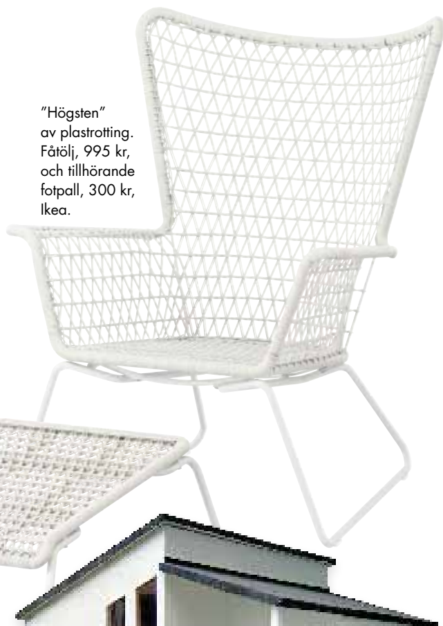
"Högsten" av plastrotting. Fåtölj, 995 kr, och tillhörande fotpall, 300 kr, Ikea.