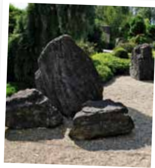
Sprängsten och gräs bildar ett snyggt, minimalistiskt arrangemang.