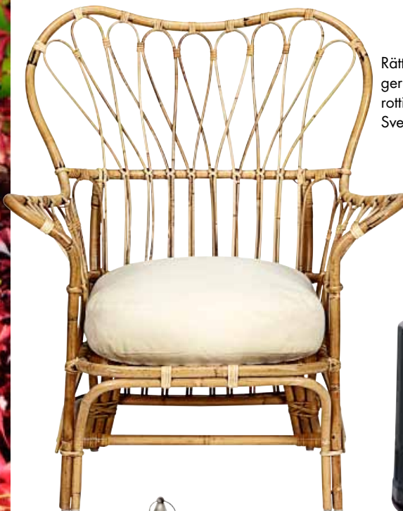
Rätta cottagestilen ger fåtölj "311" i rotting, 8 900 kr, Svenskt Tenn.