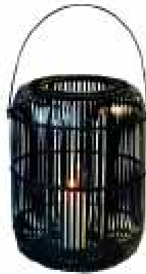
Lykta i bambu och glas, 439 kr, Wasabi Home.