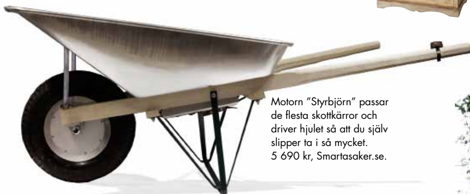
Motorn "Styrbjörn" passar de flesta skottkärror och driver hjulet så att du själv slipper ta i så mycket. 5 690 kr, Smartasaker.se.