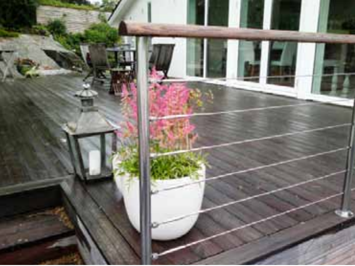
Ett vajerräcke är tillräckligt för att skapa en ombonad känsla. Pris på förfrågan, Doghouse Marine.