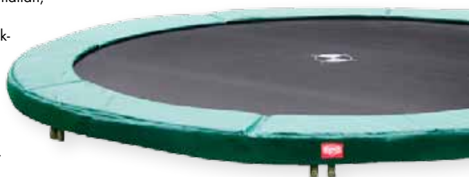
Studsattan grävs ner och stomnätet, som går runt mattan, förhindrar att någonting kommer in under konstruktionen. Om underlaget är lera krävs god dränering, sandrik jord behöver det knappast alls. "Inground", 4 790 kr, Studsexperten.