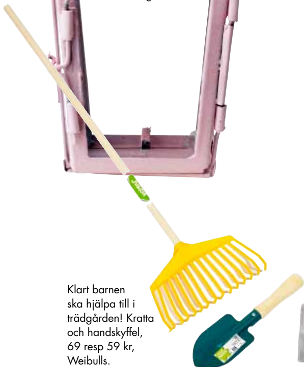
Klart barnen ska hjälpa till i trädgården! Kratta och handskyffel, 69 resp 59 kr, Weibulls.