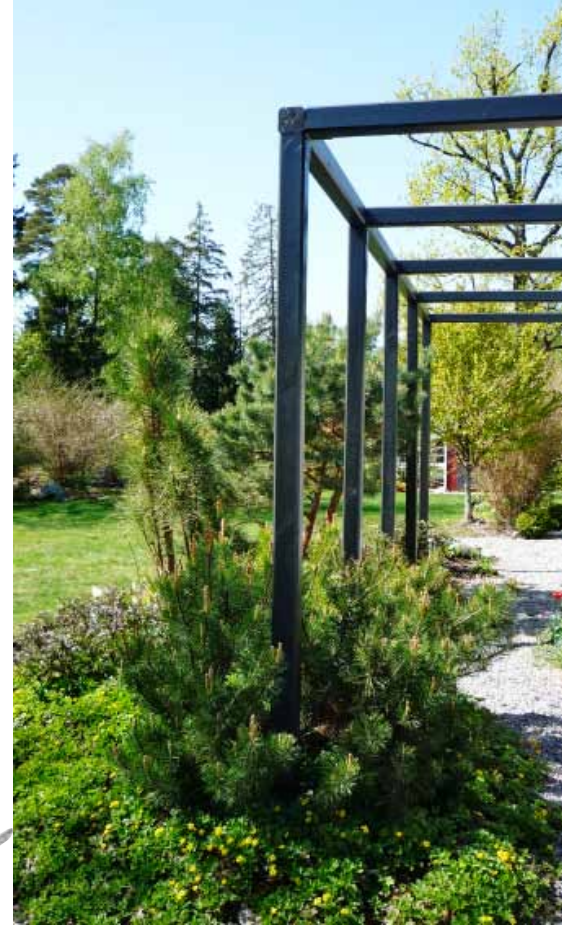
I den moderna, minimalistiska trädgården syns pergolans rejäla konstruktion tydligt.