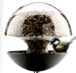
Stilrent fågelbord, 2,4 liter, 999 kr, Eva Solo.