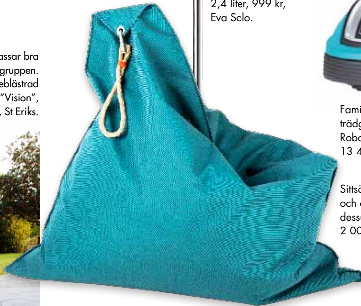
Sittsäck av kapellduk och cellplastkolor – som dessutom flyter! "Small", 2 000 kr, Celmar.