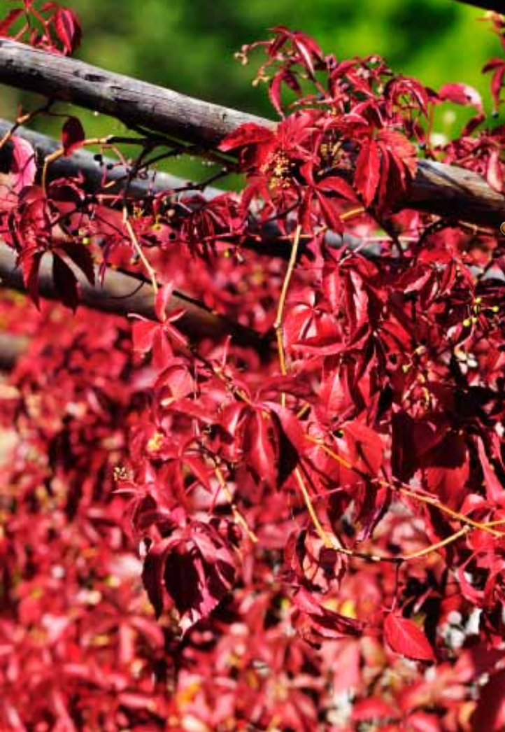
Bertil låter vildvin täcka sitt pergolatak så att konstruktionen döljs. Växterna är det primära!