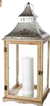
Lykta, h 30 cm, 149 kr, Blomsterlandet.