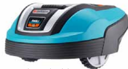
Familjen Lund undviker trädgårdsarbete om det går. Robotgräsklippare "R40Li", 13 495 kr, Gardena.