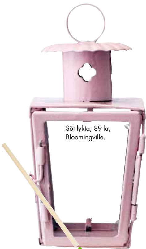
Söt lykta, 89 kr, Bloomingville.