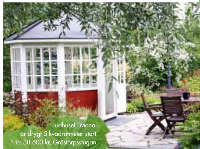
Lusthuset "Mona" är drygt 5 kvadratmeter stort. Pris: 38 600 kr, Grästorpsstugan,

Placera gärna lusthuset mitt i trädgården, så att du kan njuta av grönskan runtom!