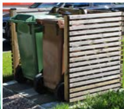
Det är klokt att planera för sopsortering med två tunnor.

Soptunnan hör till det minst glamorösa detaljerna vid en entré och just därför är dess placering desto viktigare. I planeringsstadiet kan det vara klokt att tänka två tunnor, eftersom allt fler kommuner uppmanar till att matavfall ska sorteras och hämtas separat. Att kunna slänga sopor på väg mot bilen eller gatan är ett stort plus liksom att kunna gå torrskodd i tofflorna från huset.