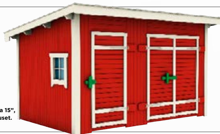
"Saga 15", Trähuset.

på 110 cm kräver inte bygglov. Ett plank behöver i regel bygglov med vissa undantag såsom om planket har ett ljusgenomsläpp som motsvarar 50 procent.