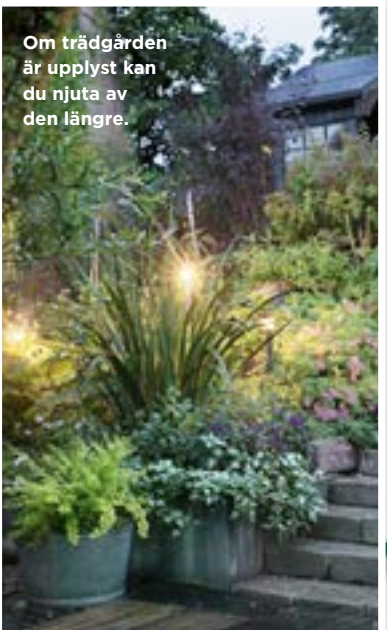
Om trädgården är upplyst kan du njuta av den längre.

Belysning med svagström kan du montera själv.