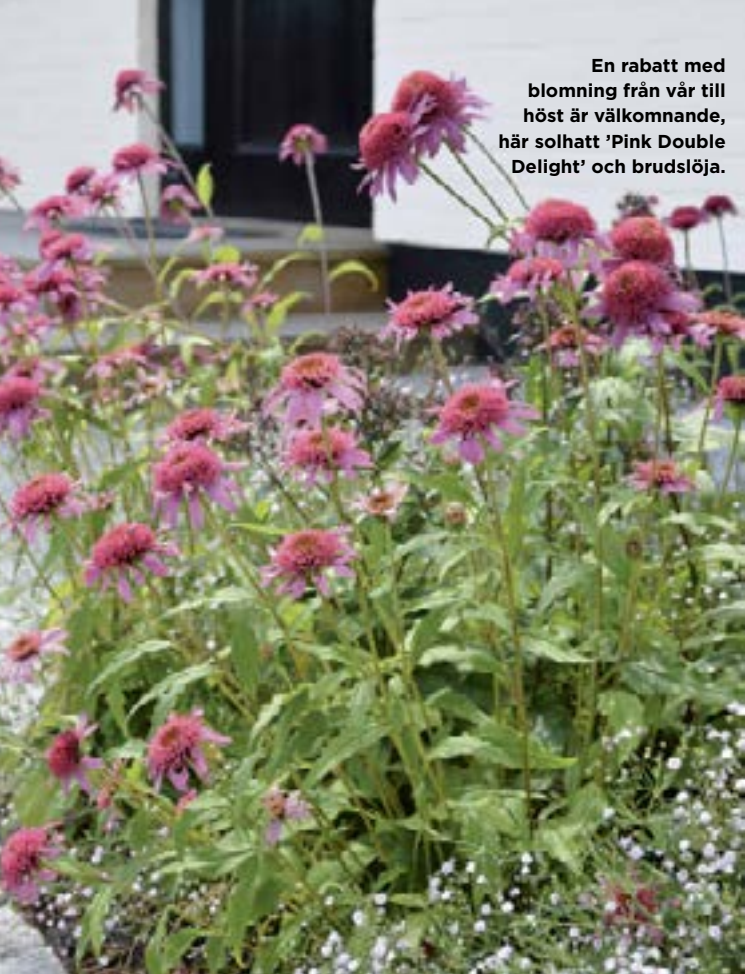
En rabatt med blomning från vår till höst är välkommande, här solhatt 'Pink Double Delight' och brudslöja.