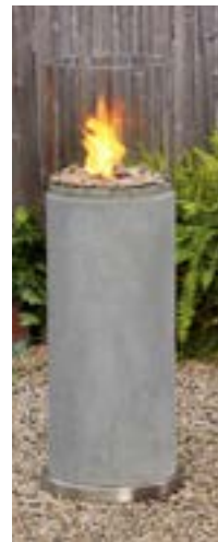
Eldpelaren "Modesto 803" av fibergjuten betong och hårdat glas. Från www.realflame.se .

Lågorna från en eld har i alla tider skänkt njutning och är välkommande för gäster. Utekaminer och eldpelare med speciellt bränsle sprider värme och kan utan fara placeras under utetaket.