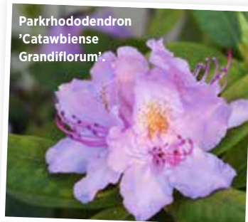
Parkrhododendron 'Catawbiense Grandiflorum'.

'Fantastica', purpurröda blommor. 'Kalinka', ceriserosa blommor. 'Koichiro Wada', mörkrosa blommor som bleknar.